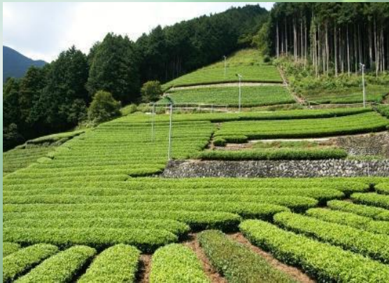
茶畑が美しい静岡市葵区大代地区

本プロジェクトは、3年間にわたる農村体験の中から課題を探り出し、その解決策の提案・試行をとおして、将来、日本の過疎村や農業の問題を考えてゆける人材を育成するというものです。平成22年に最初の農業環境リーダーを認定してから今年度で8期目のリーダーたちを認定する運びとなりました。