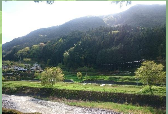
稲子川とともに暮らす富士宮市稲子地区